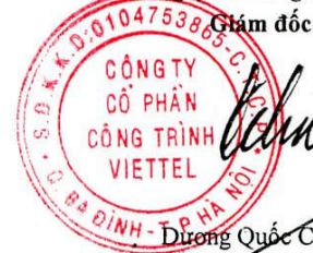
Đương Quốc Chính